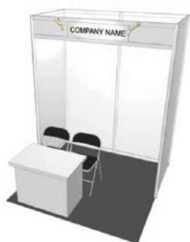
1小間パッケージ内容